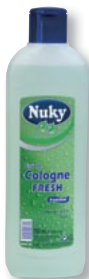
REF. 612 Colonia fresca 750 ml Caja de 12 unidades