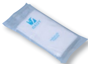
REF. 4490 Pañuelos celulosa hotel Paquete de 5 unidades Caja de 1000 paquetes