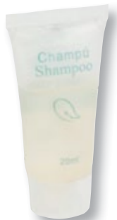
REF. 3652 Champú tubo PP 20 ml Caja de 500 unidades