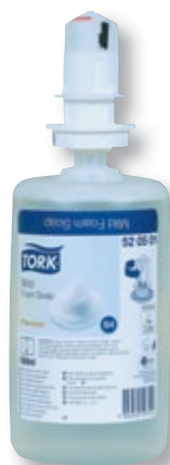
REF. 7080 Jabón manos TORK espuma S-4 520501 Caja de 6 unidades