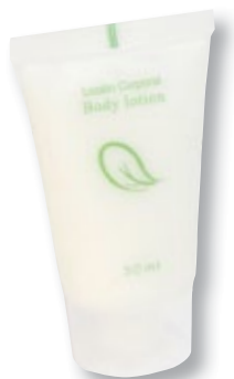
REF. 4414 Loción corporal 30 ml anónimo Caja de 500 unidades