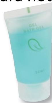
REF. 4360 Gel tubo PP 30 ml anónimo Caja de 300 unidades