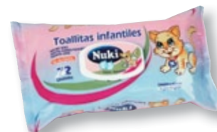
REF. 4040 Toallitas húmedas bebe Paquete de 72 unidades Caja de 12 paquetes