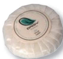
REF. 1897 Jabón hotel 15 gr anónimo Caja de 1000 unidades