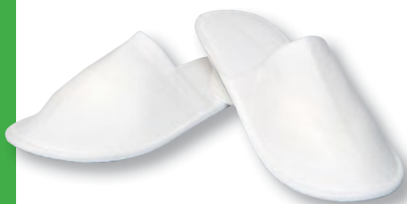
REF. 4367 Zapatilla cerrada felpa suela 0,3 cm Caja de 250 unidades