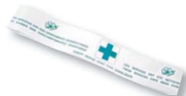
REF. 1213 Precinto wc papel millar Caja de 5 paquetes