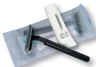
REF. 1400 Set afeitador cristal hotel Caja de 500 unidades