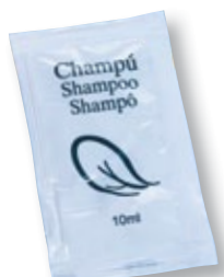
REF. 1899 Champú sobre anónimo Caja de 1000 unidades