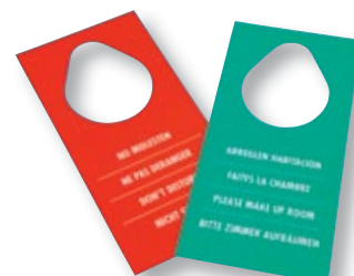
REF. 1743 Cartel no molesten Paquete de 100 unidades