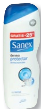
REF. 1326 Gel dermo Sanex 600 ml Caja de 12 unidades