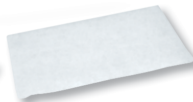
REF. 1161 Esponja jabonosa fibra BB3 12x20x1 Caja de 2700 unidades