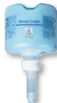
REF. 2293 Crema de ducha mini TORK S-2 420602 Caja de 8 unidades