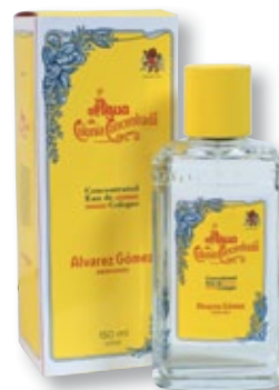
REF. 1817 Colonia concentrada vap Alvarez Gómez 150 ml Caja de 6 unidades