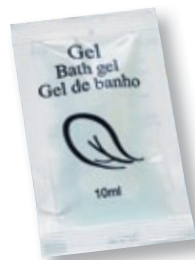
REF. 1898 Gel sobre hotel anónimo Caja de 1000 unidades