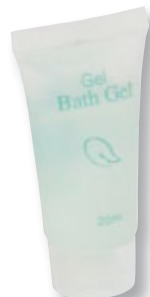
REF. 3653 Gel tubo PP 20 ml Caja de 400 unidades