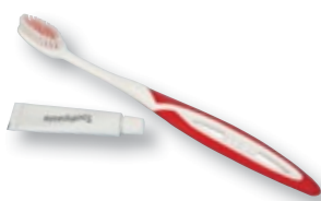
REF. 1399 Set dental cristal hotel Caja de 500 unidades