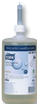
REF. 470 Jabón líquido TORK extra higiene S-1 420810 Caja de 6 unidades