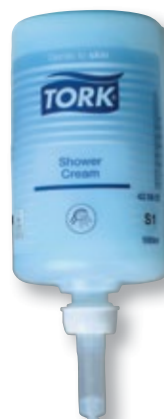
REF. 556 Jabón manos líquido TORK cuerpo/cabello 1L S-1 420601 Caja de 6 unidades