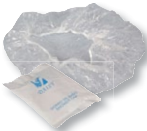
REF. 308 Gorro ducha hotel Caja de 1.000 unidades