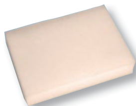
REF. 390 Esponja jabonosa BS3 monodosis 9x13 cm Caja de 1200 unidades