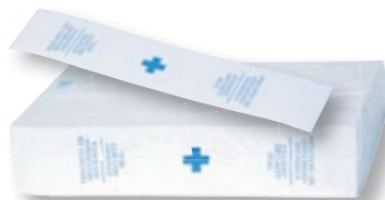
REF. 2144 Precinto wc adhesivo Paquete de 500 unidades Caja de 20 paquetes