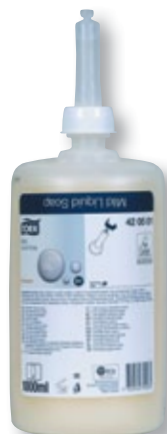
REF. 7079 Jabón manos líquido suave S-1 1L TORK 420501 Caja de 6 unidades