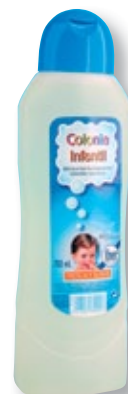
REF. 2566 Colonia infantil Iber 750 ml Caja de 12 unidades