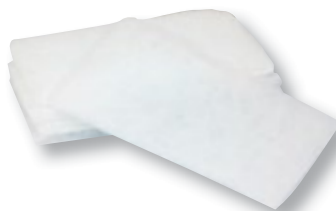
REF. 4319 Esponja jabonosa fina BB1 12x20x1 cm Caja de 3000 unidades