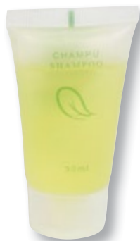
REF. 4361 Champú tubo PP 30 ml anónimo Caja de 300 unidades