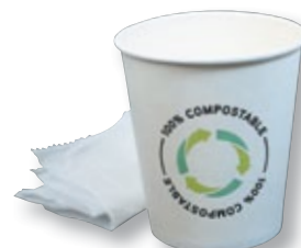
REF. 1172 Vaso hotel papel 200cc con bolsa Caja de 500 unidades