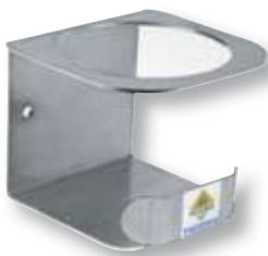
REF. 1834 Soporte pared inoxidable hidroalcohólico 500 ml