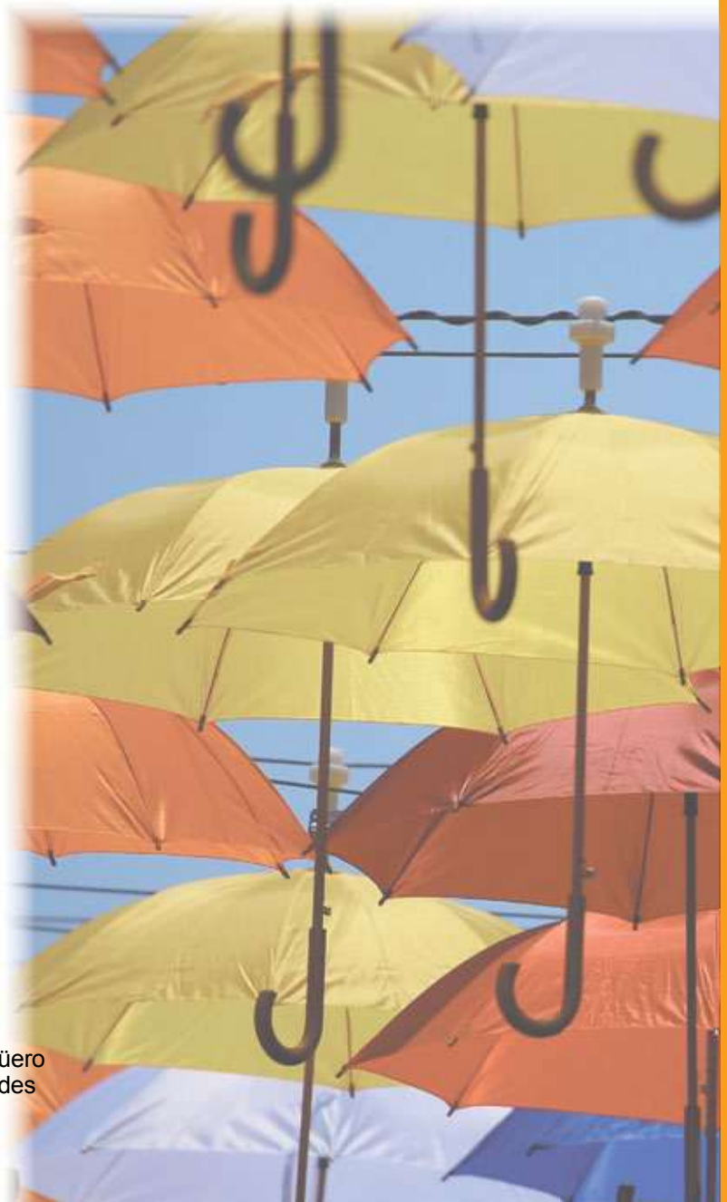
REF. 3509 Recambio fundas paragüero Paquete de 2.000 unidades