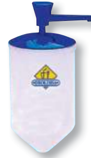
REF. 290 Dosificador gel taller 1,5 litros