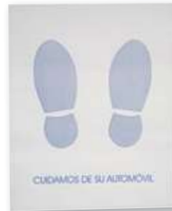
REF. 3789 Alfombrilla huella pies 44x54 cm Caja de 500 unidades