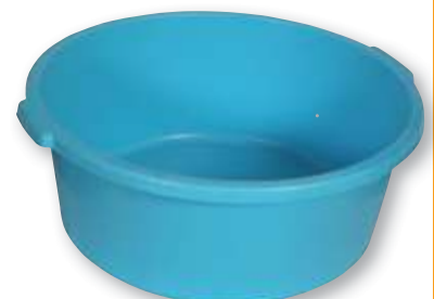
REF. 1496 Barreño redondo reciclado 20 litros