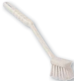
REF. 576 Escobilla fregatodo plástico