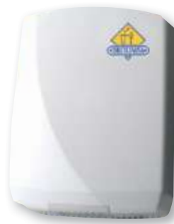
REF. 296 Secamanos Futura óptico AA14000