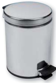
REF. 374 Cubo para baño 12 litros con pedal inoxidable