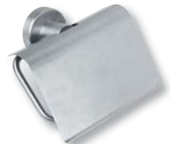
REF. 2451 Dispensador higiénico 1 rollo inoxidable doméstico