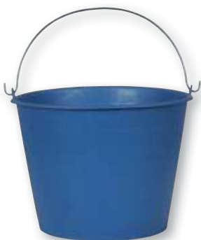
REF. 1509 Cubo agua cristalero color 6 litros