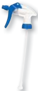
REF. 4454 Cabeza pulverizador azul para botella de litro