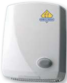
REF. 292 Secamanos Futura pulsador AA13000