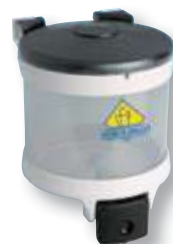
REF. 303 Dosificador gel dosico 1000 E 1 litro