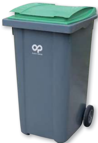
REF. 1064 Contenedor con ruedas Omnium 240 litros 1075x580x725 mm