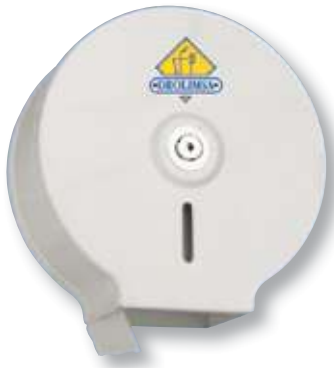
REF. 1407 Dispensador higiénico ancho blanco AE12400