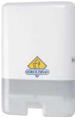
REF. 1197 Dispensador toalla H2 TORK XPRESS blanco