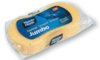
REF. 3868 Esponja coche Jumbo anatómica Caja de 5 unidades