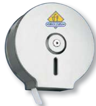
REF. 1180 Dispensador inoxidable higiénico ancho 300 m AE-21000