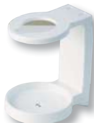
REF. 1831 Soporte pared blanco hidroalcohólico aseptico 500 ml