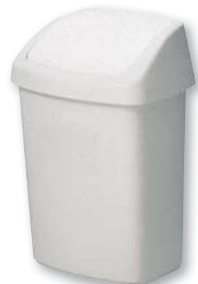
Pongotodo Swingtop blanco REF. 273 12 litros REF. 532 25 litros REF. 1194 50 litros