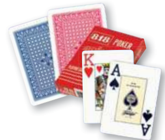
REF. 742 Baraja póker nº 818 Caja de 12 barajas