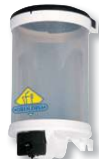
REF. 304 Dosificador gel dosico 2000 E 2 litros