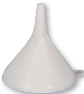
REF. 1075 Embudo plástico 12 cm