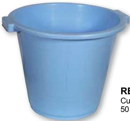
REF. 214 Cubo colada alto 50 litros