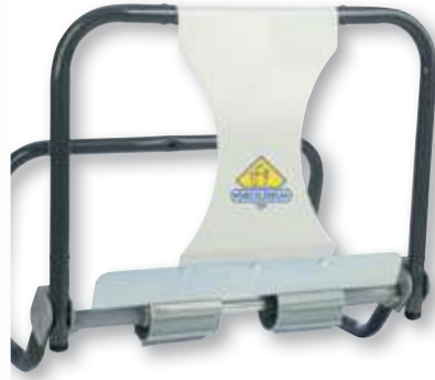
REF. 291 Dispensador bobina pared mural AD10000