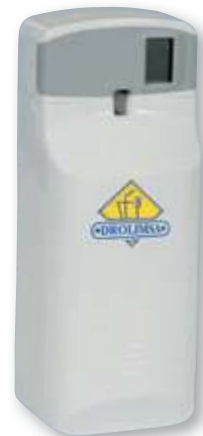
REF. 3436 Dispensador bacteriostático UNICORN