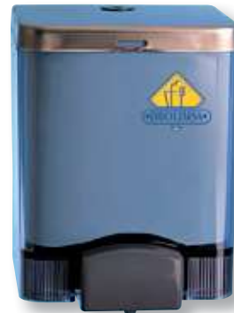
REF. 287 Dosificador gel Vision AC21150 1,4 litros