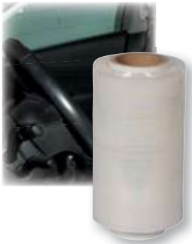
REF. 3790 Cubrevolantes bobina film 150 m Caja de 40 bobinas