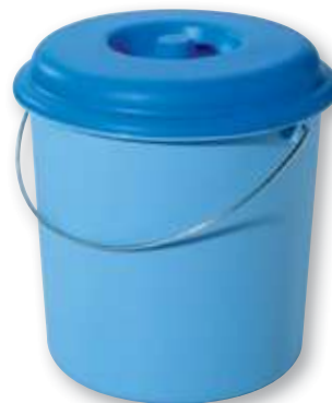
REF. 188 Cubo basura con tapa Plastiken 23 litros