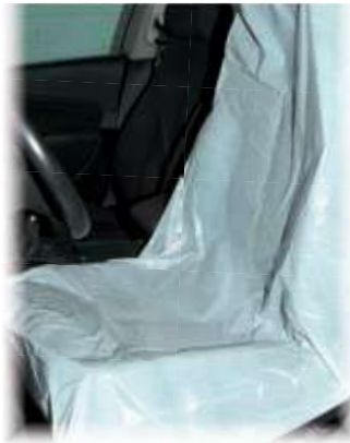
REF. 3788 Cubreasiento blanco 79x130/18my R 250