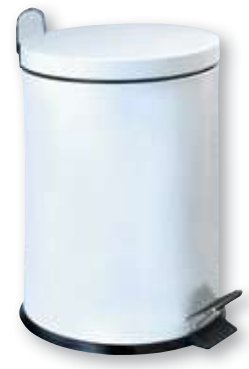
REF. 4642 Cubo para baño 20 litros metálico blanco