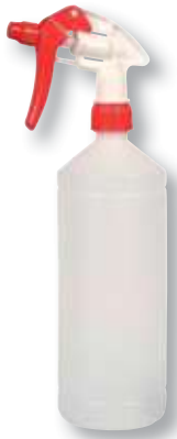
REF. 3874 Pulverizador químico rojo botella 1 litro