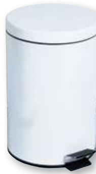
REF. 4643 Cubo para baño 12 litros metálico blanco