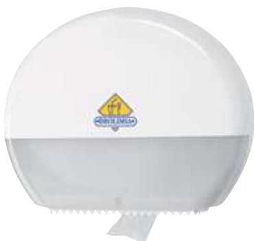
REF. 307 Dispensador higiénico T1 Gigant Tork t-box blanco