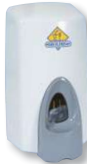
REF. 230 Dosificador gel espuma Foamsoap