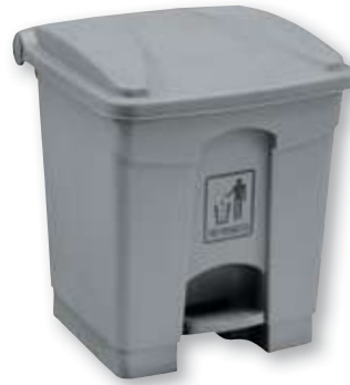
REF. 2577 Papelerera universal con pedal 30 litros gris 7315