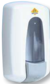
REF. 1892 Dosificador gel Aitana blanco AC70000