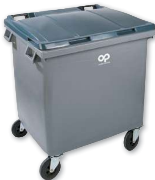
REF. 2477 Contenedor con ruedas Omnium 1000 litros 1300x1265x1070 mm