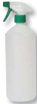
REF. 1354 Pulverizador económico verde botella 1litro