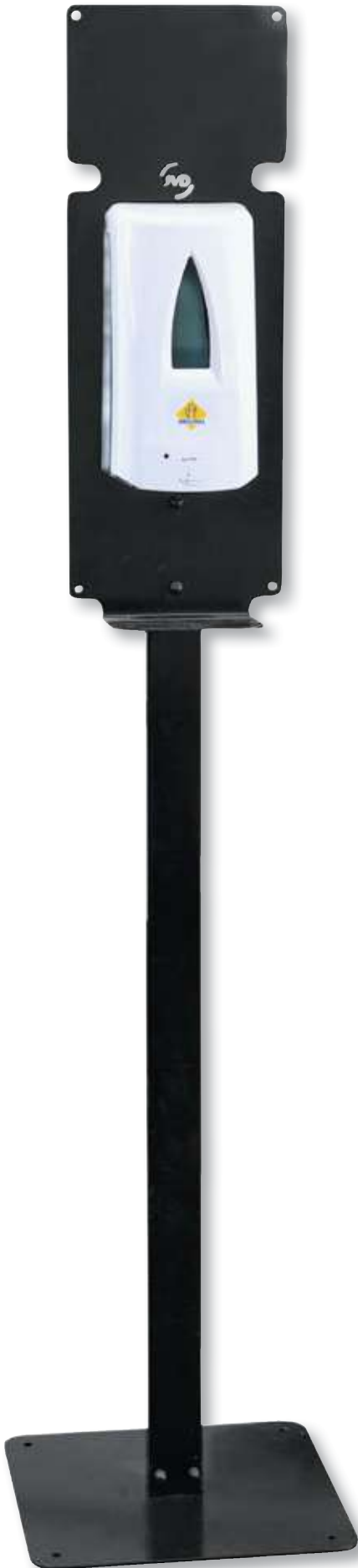
REF. 1829 Estacion limpieza yaliss gel automatica