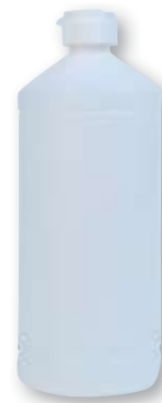
REF. 455 Botella tapón unidireccional 1 litro