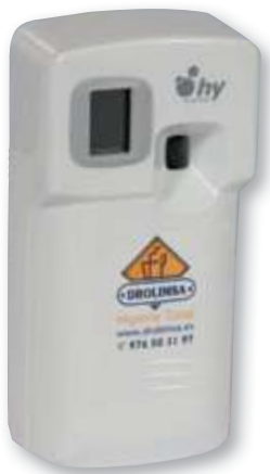
REF. 2968 Dispensador Microbust aerosol programable