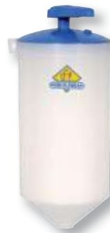
REF. 37 Dosificador gel taller 2 litros