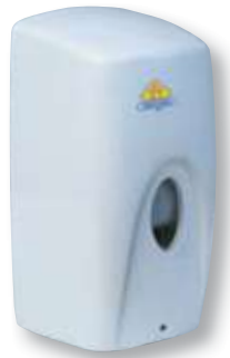
REF. 3065 Dosificador gel automático ac91050