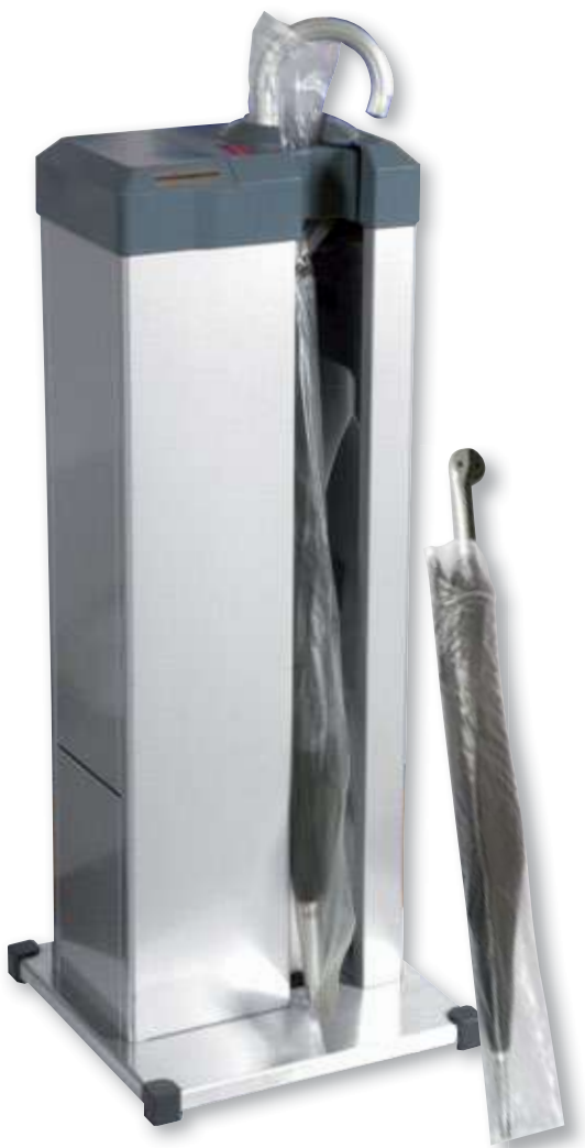
REF. 3508 Paragüero enfundador COVER MAS