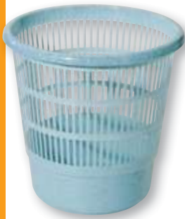
REF. 727 Papelerera rejilla nature 16 litros