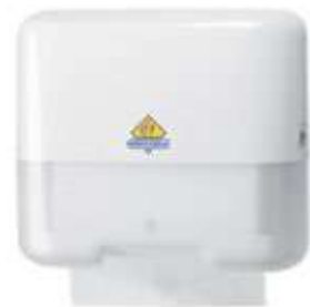
REF. 971 Dispensador toalla mini TORK XPRESS blanco H2