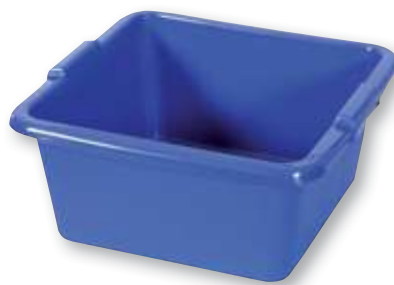
REF. 1222 Barreño cuadrado liso 15 litros