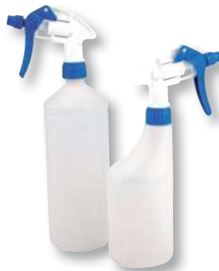
REF. 743 Pulverizador extra azul de 1 litro