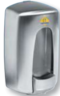
REF. 2200 Dosificador gel Aitana AC 79000 inoxidable