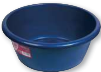
REF. 207 Barreño plástico redondo 10 litros