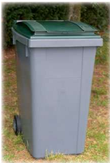
REF. 1067 Contenedor con ruedas Omnium 360 litros 1090x620x850 mm