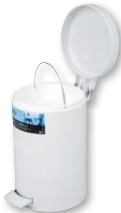
REF. 196 Cubo con pedal para baño blanco 5 litros