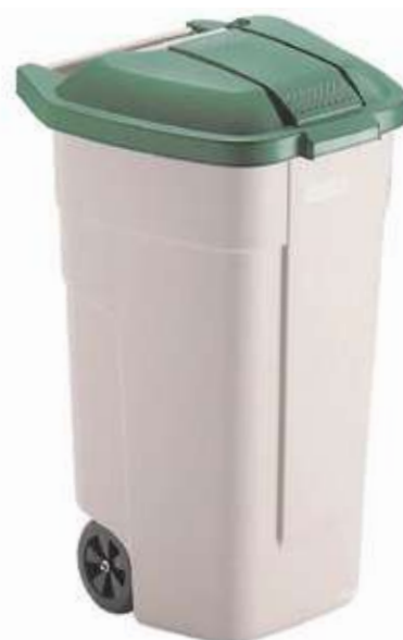
REF. 2054 Contenedor Rubbermaid con ruedas 800x505x525 mm tapa verde 100 litros