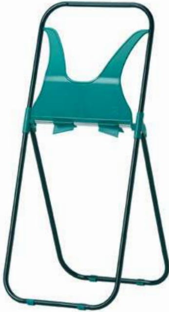
REF. 1178 Dispensador bobina Industrial pie suelo