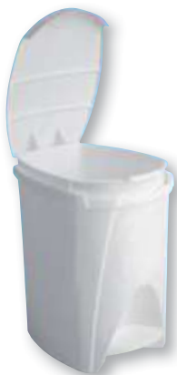
REF. 1195 Cubo pedal plástico 7 litros Plastiken