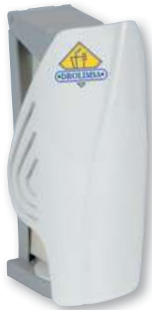
REF. 3831 Dispensador TCELL fragancia continua