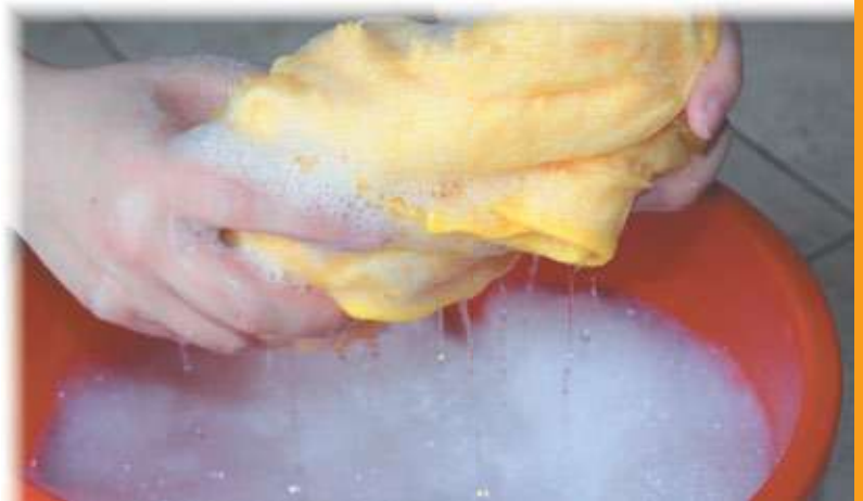
REF. 2127 Cubo agua cristalero blando 12 litros