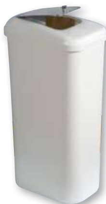
REF. 2820 Contenedor higiénico sanitario 40 litros