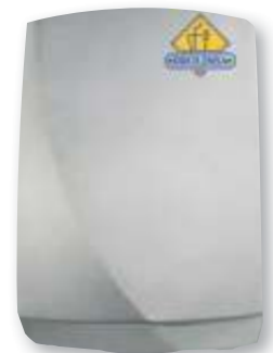
REF. 3502 Secamanos Futura óptico inoxidable AA16500