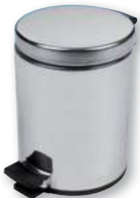
REF. 352 Cubo para baño 5 litros con pedal inoxidable