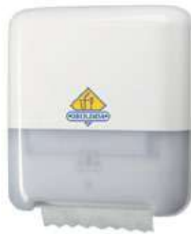
REF. 101 Dispensador REF 551000 TORK MATIC BOX H1