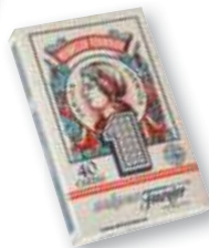
REF. 740 Baraja guiñote nº 1 40 cartas Caja de 12 barajas