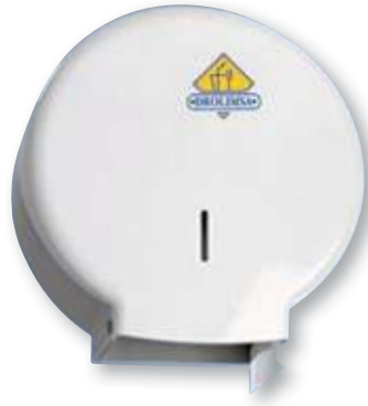
REF. 3564 Dispensador plástico blanco higiénico ancho AE5100