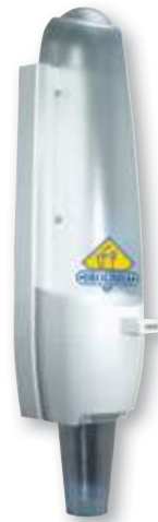
REF. 1048 Dispensador de vasos 160 cc y 220 cc