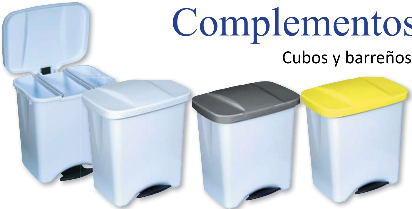
REF. 4433 Cubo pedal 50 litros Tapa blanca