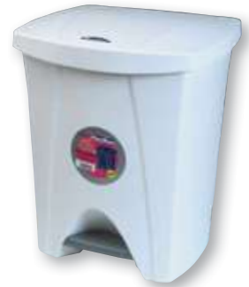
REF. 1169 Cubo pedal plástico cuadrado 25 litros