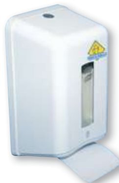
REF. 764 Dispensador higiénico BulkTork blanco