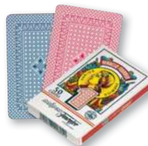
REF. 952 Baraja guiñote nº 1 50 cartas Caja de 12 barajas