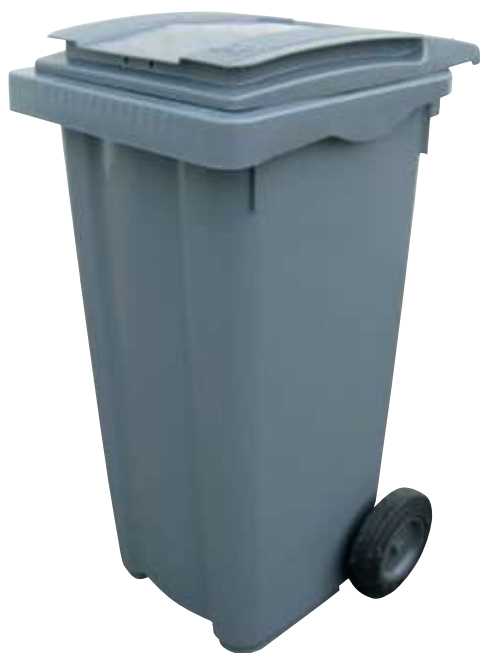
REF. 1063 Contenedor ruedas Omnium 120 litros 980x485x550 mm