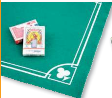
REF. 1249 Tapete verde 50x50x0,2 cm