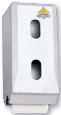
Dispensador higiénico 2 rollos